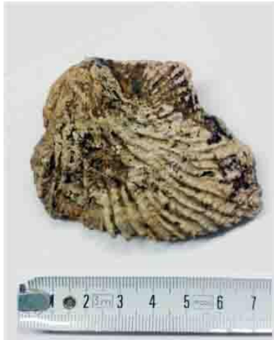
Fig. 3. Spondylus gandariasi . Exterior de la valva izquierda, mostrando la costulación característica.

Notas - La asignación genérica se ha hecho atendiendo sobre todo a la charnela. El Dr. Hautmann (Museo de Zurich) contestó así a nuestra pregunta sobre el asunto: “Judging from the morphology of the hinge teeth, this is most likely a Spondylus ” (com. email de 8.4.2015)