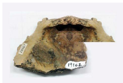
Fig 2. Spondylus gandariasi . Interior de la valva izquierda, reconstruida en su parte derecha por técnicas informáticas, para mostrar la totalidad de la charnela.