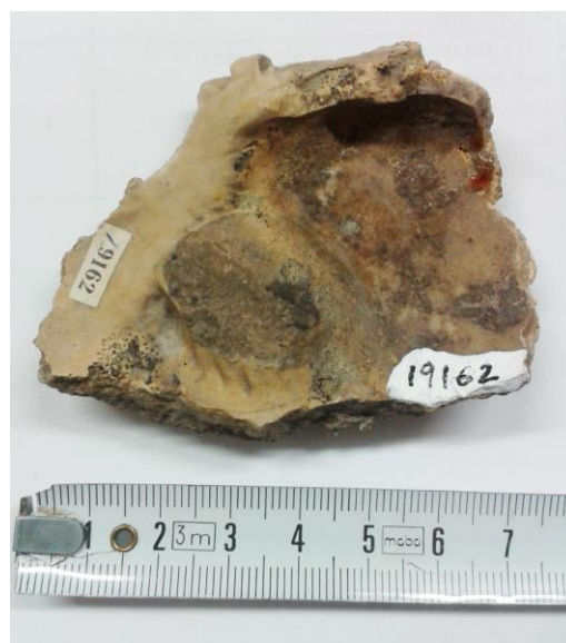
Fig. 1: Spondylus gandariasi n.sp. Interior de la valva izquierda.

Las aurículas son triangulares, dibujando un ángulo de unos 120° en su parte más externa. Están cubiertas por costillitas, casi perpendiculares a la línea del contacto con el resto de la concha. Se cuentan unas 15 y su sección es redondeada y están separadas por espacios intercostales menores.