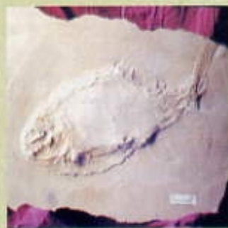
Peix, Alcoveria brevis . Triàsic d'Alcover (Tarragona)

Els fòssils són restes d'organismes vius, els quals van viure en una època del temps anterior a l'actual. També es consideren com a fòssils les restes de la seva activitat, això és, les seves petjades, els rastres, els habitatges, les defecacions, etc.