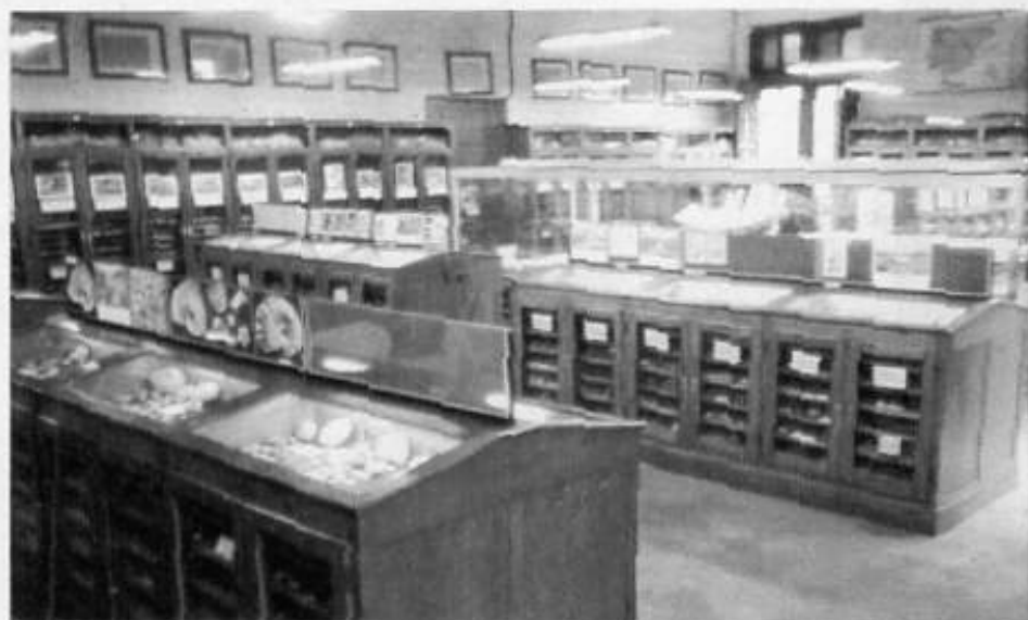
Sala principal del Museu. Any 1977