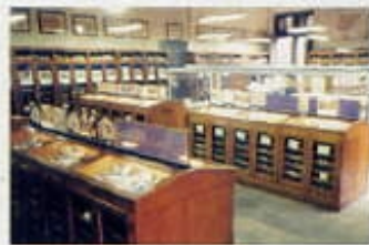
Sala principal del Museo