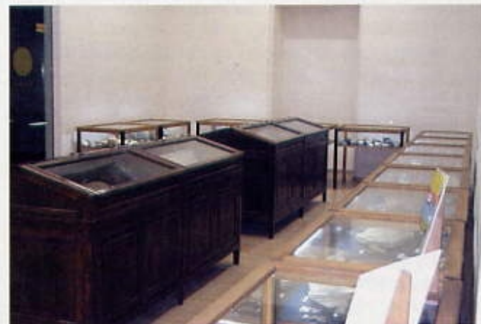
La nova Sala Cardenal Carles

El programa docent que es desitja desenvolupar a la Sala Cardenal Carles tindrà com a lema "Coneix la teva Terra", amb la intenció de mostrar als joves un aspecte fonamental del seu entorn; la naturalesa inanimada de les roques i tota la història que les