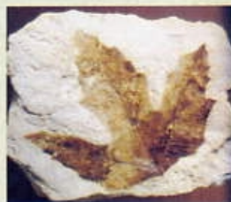
Fulla d' Acer sp. Sant Feliu de Llobregat (Barcelona)

No tots els organismes que viuen en un mateix medi tenen les mateixes possibilitats de fossilització: els organismes de cos tou en tenen molt poques. Normalment, només es troben fossilitzades les parts dures que són les més resistents dels organismes, és a dir, els esquelets i les conques. De vegades, es conserven les parts toves en forma d'impressions, si els sediments són prou fins per preservar-los (fulles de vegetals a l'argila; les meduses i altres organismes tous a les dolomies litogràfiques d'Alcover i Mont-rat). Són excepcionals els conservats en ambre (insectes del Bàltic o de la República Dominicana) o l'asfalt (mamífers i aus a La Brea de Califòrnia).