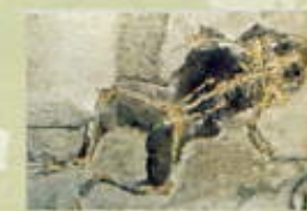
Rana pueyoi . Libros (Terol)

En molts casos, a causa de fenòmens de dissolució de les aigües subterrànies que circulen per l'interior de les roques, desapareixen les parts dures originals. Llavors, els fòssils queden reduïts a l'estat de motlles. Els espais ocupats anteriorment pels esquelets o les conques ara resten buits. La part interior rocosa que ocupava les parts buides de dit esquelet o conquilla rep el nom de motlle intern; la part exterior, en contacte amb la roca, rep el nom de motlle extern.