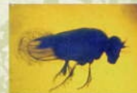
Dípter en ambre. Mar Bàltic

L'estudi dels fòssils permet reconstruir la història de la vida; val a dir, exagerant una mica, que sense els fòssils la teoria de l'evolució seria una mera hipòtesi. Els fòssils informen de l'edat de les roques on es troben: cada període de la història de la Terra conté els seus característics. També ajuden a conèixer on es van originar aquestes roques: per exemple, trobar la closca d'una cloïssa en una argila, és la indicació que aquesta roca es va originar al mar. (Antonio Abad)